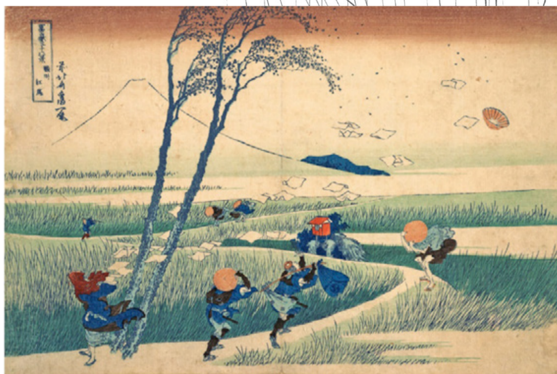
@Katsushika Hokusai, Eijiri in the province of Suruga (Suncha Ejiri)

Ogni volta che disegno sorrido pensando alla storia della pioggia che non bagna